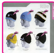
Beanies & Woolie