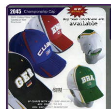
Micro Mesh Cap